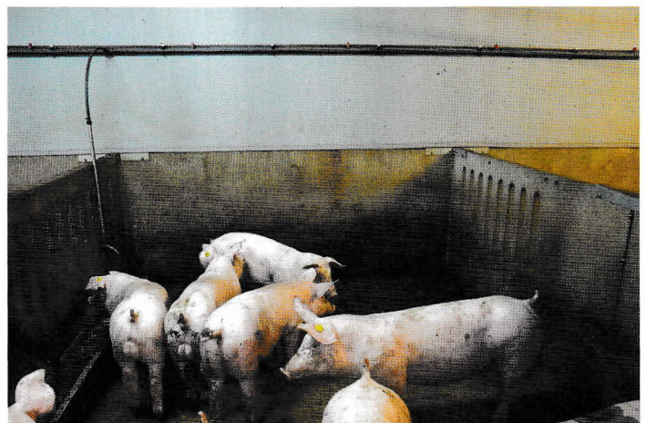
Van de installatie-unit is naar de afdeling een RVS-leiding geïnstalleerd, waar in de afdeling elke 80 cm een spuitdop is gemonteerd.