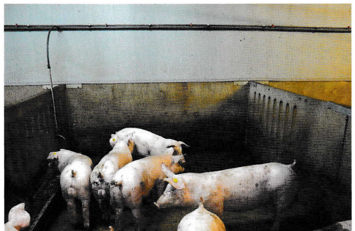
Van de installatie-unit is naar de afdeling een RVS-leiding geïnstalleerd, waar in de afdeling elke 80 cm een spuitdop is gemonteerd.