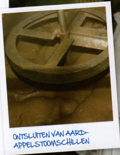
ONTSLUITEN VAN AARD-APPELSTOOMSCHILLEN